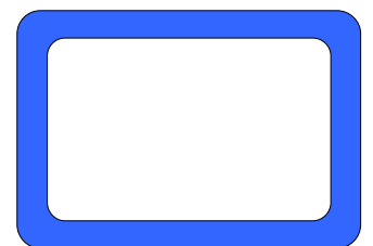
une ardoise Velleda