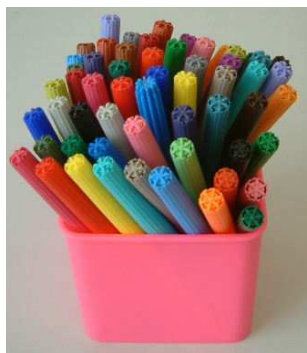
des feutres de couleurs