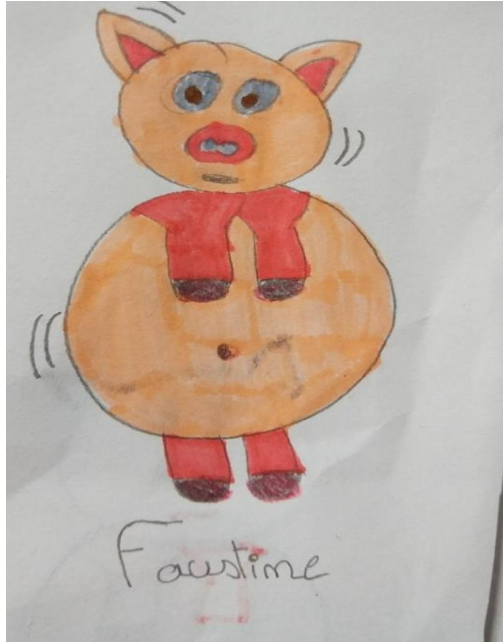
Faustine cm1 Bléré