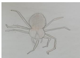
Dessin d'Eloa cm1 Bléré

-Tiens, tiens ! Voilà pour toi sale bête et l' araignée crasch crasch ! est écrabouillée.