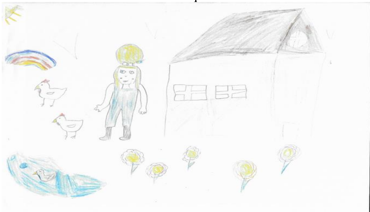
Illustration de Louise cm1 Ecole de Bléré

La fermière rentre dans l' étable pour une petite visite à sa vache et là, par terre, une araignée grosse , gROSSE comme ça.