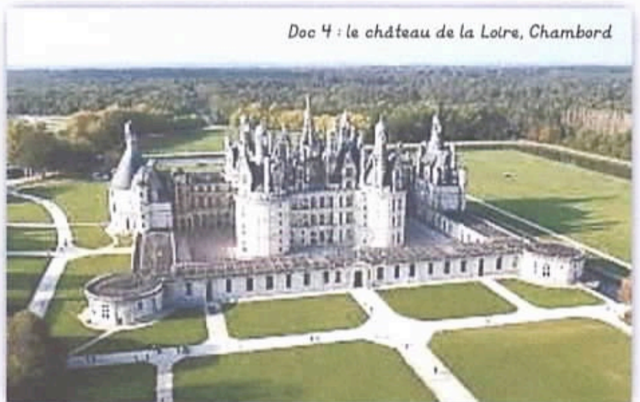
Doc 4 : le château de la Loire, Chambord

Le château de Chambord, construit sous François I er , comprend 440 chambres et 365 cheminées. Le parc comprend aujourd'hui 5 500 hectares de bois fermés par un mur de 32 kilomètres de long.